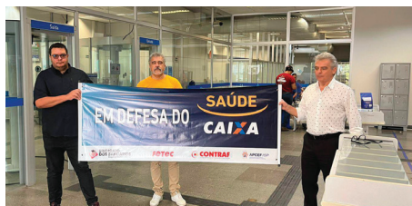
Os diretores conversaram com os funcionários sobre o Dia de Luta